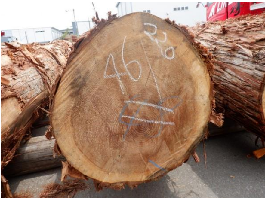
R4. 5. 25春季優良原木市 (220~237)