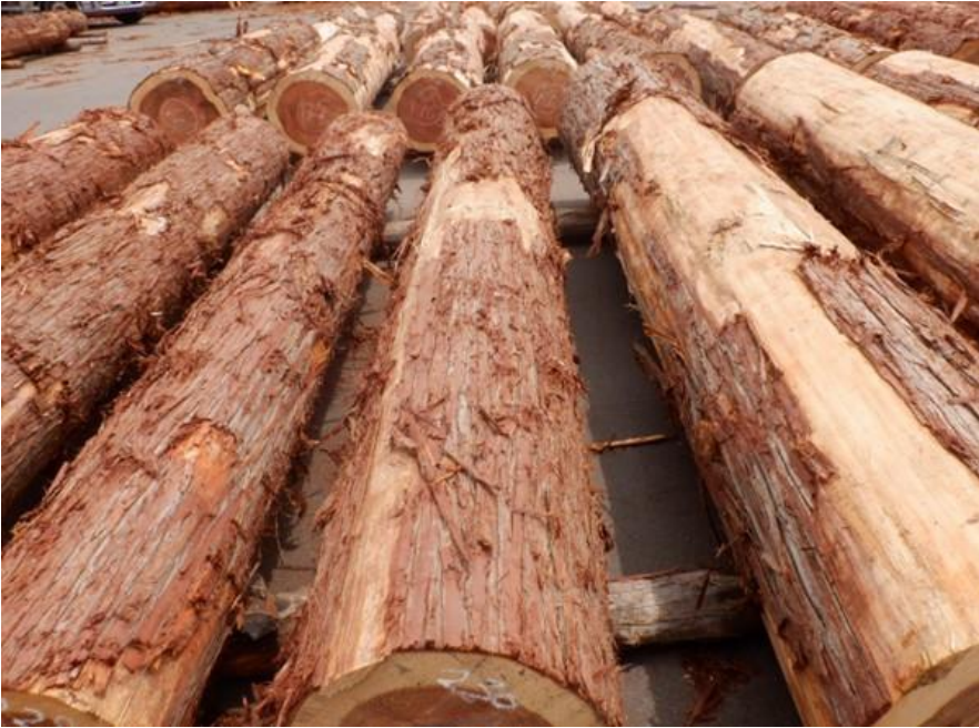
R4. 5. 25春季優良原木市 (220~237)