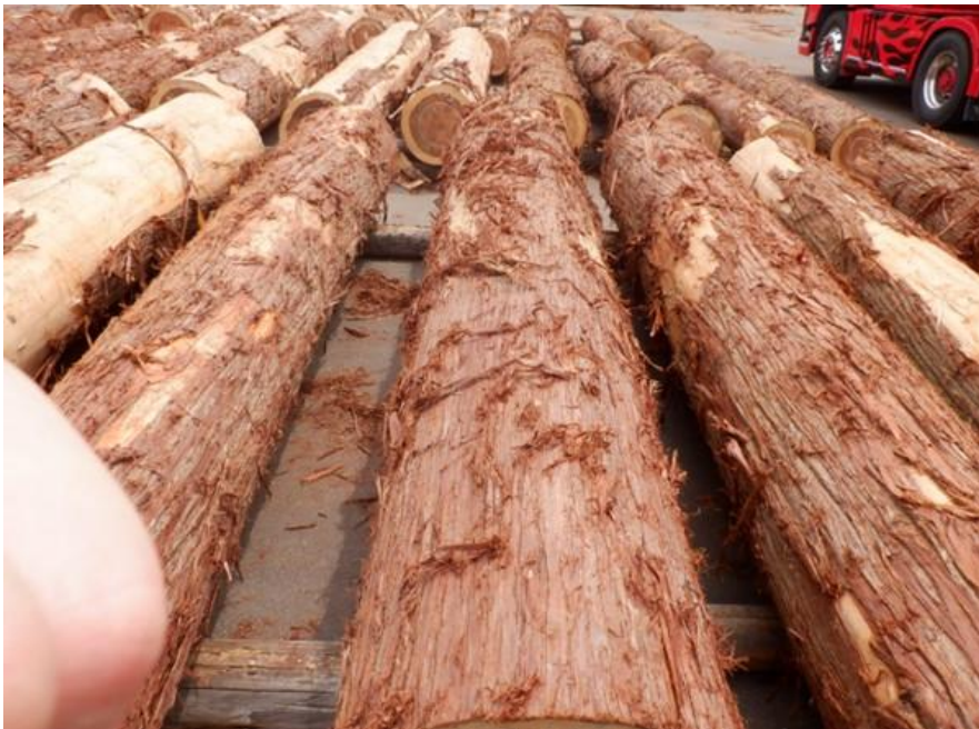
R4. 5. 25春季優良原木市 (220~237)