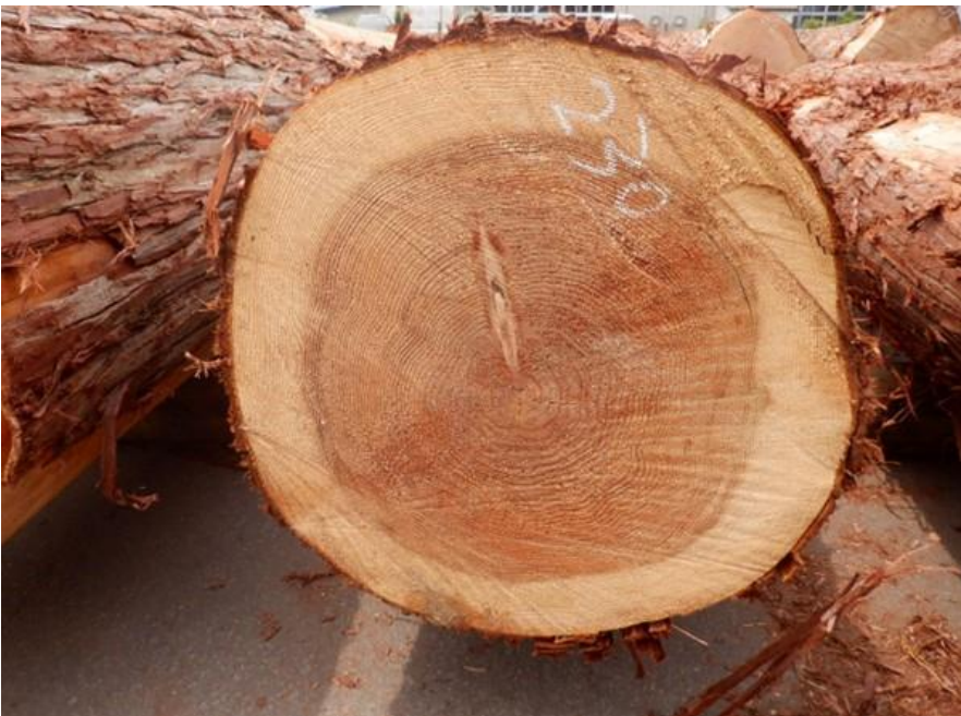
R4. 5. 25春季優良原木市 (220~237)