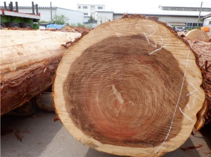
R4. 5. 25春季優良原木市 (220~237)