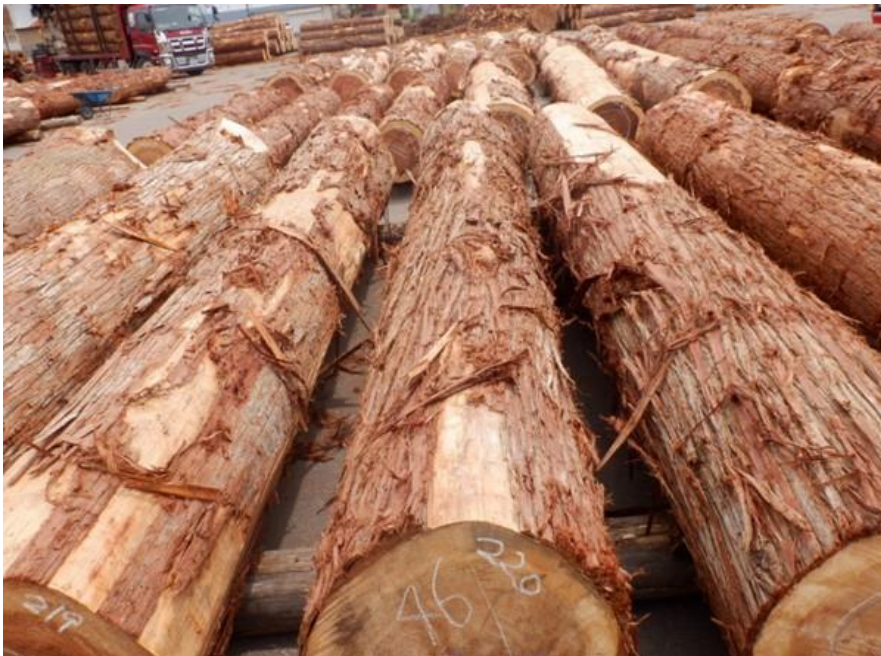
R4. 5. 25春季優良原木市 (220~237)