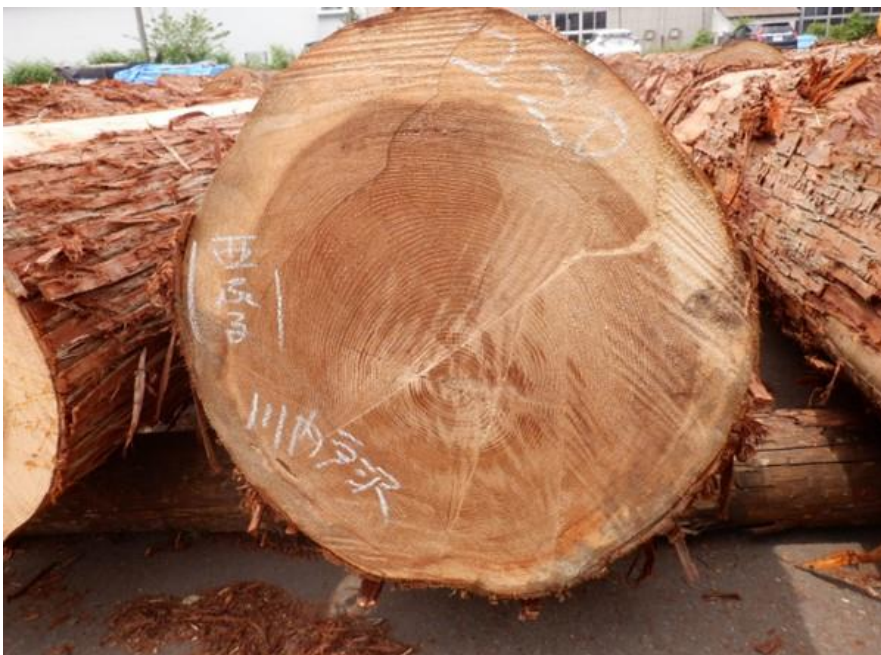
R4. 5. 25春季優良原木市 (220~237)