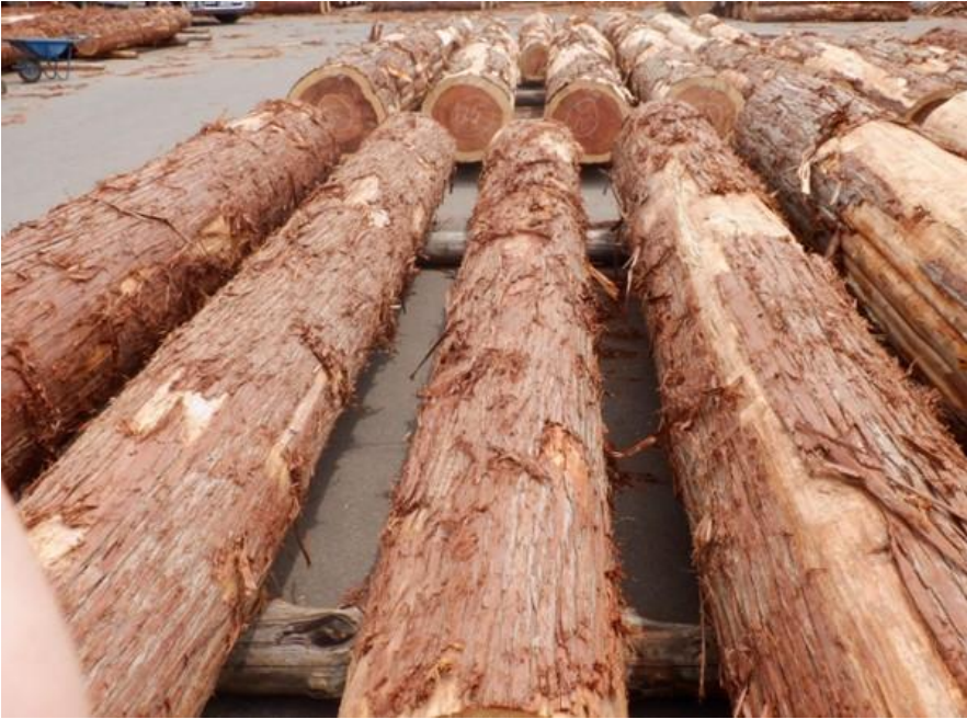
R4. 5. 25春季優良原木市 (220~237)