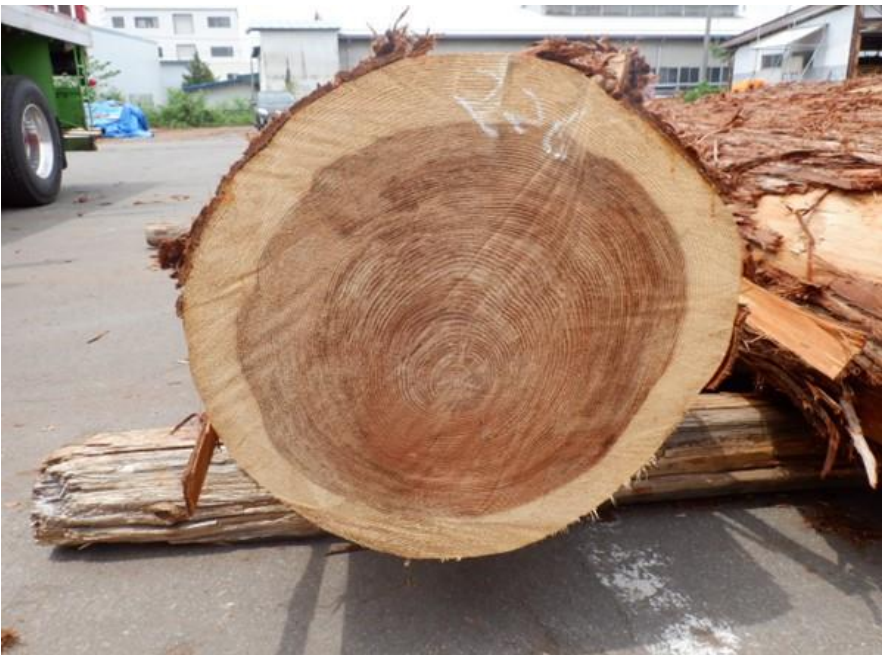
R4. 5. 25春季優良原木市 (220~237)