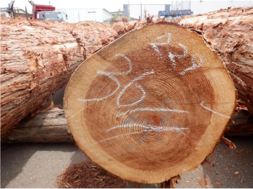
R4. 5. 25春季優良原木市 (220~237)