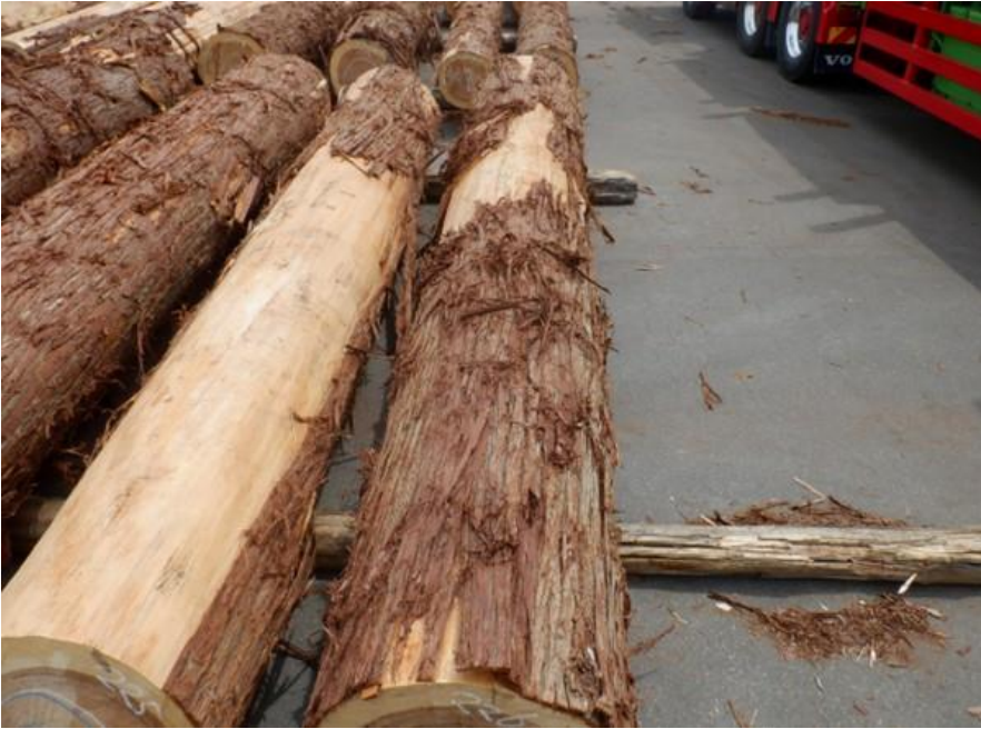
R4. 5. 25春季優良原木市 (220~237)