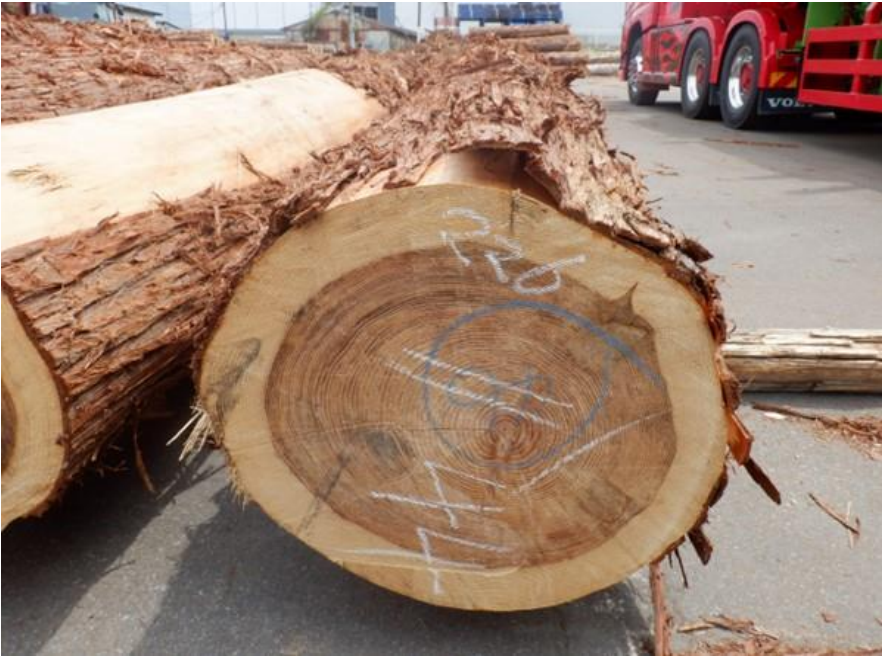
R4. 5. 25春季優良原木市 (220~237)