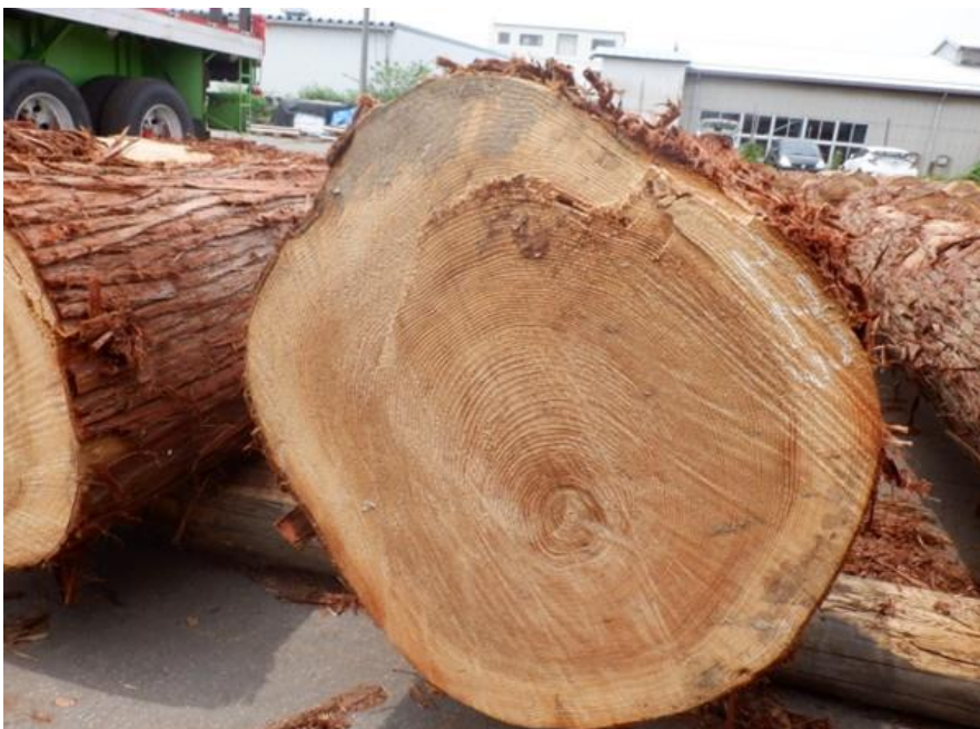
R4. 5. 25春季優良原木市 (220~237)