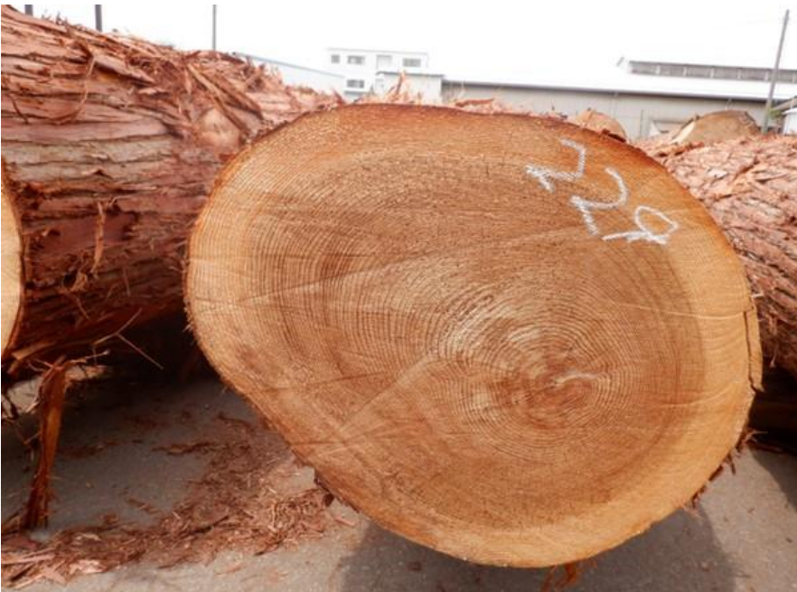
R4. 5. 25春季優良原木市 (220~237)