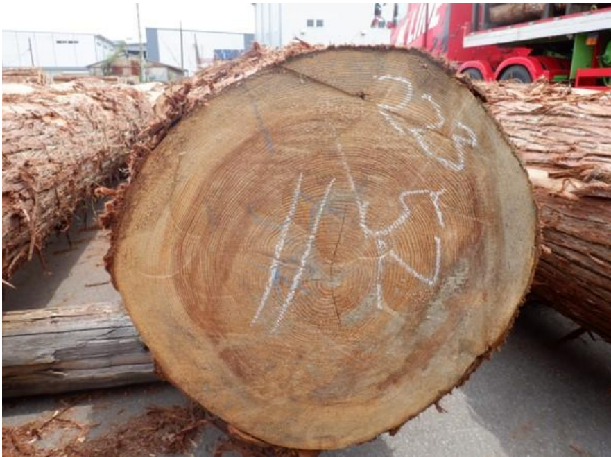
R4. 5. 25春季優良原木市 (220~237)