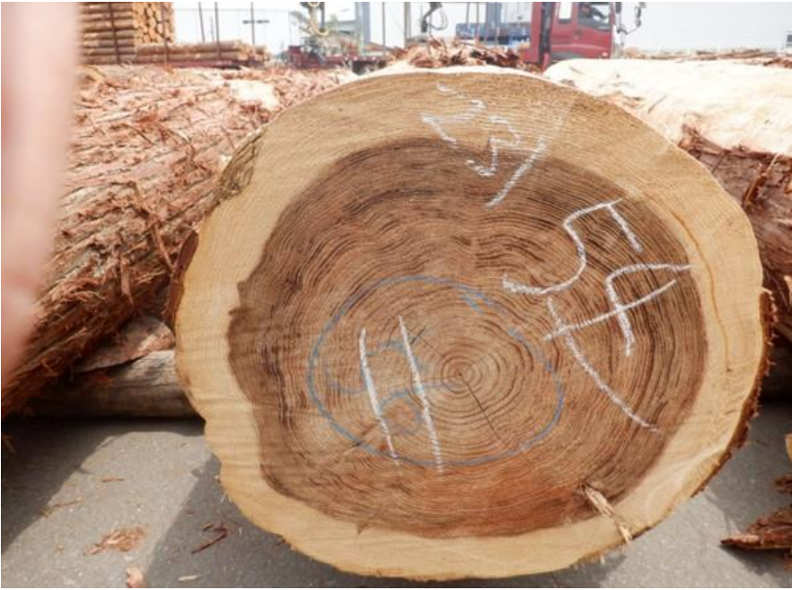
R4. 5. 25春季優良原木市 (220~237)