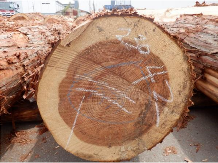
R4. 5. 25春季優良原木市 (220~237)