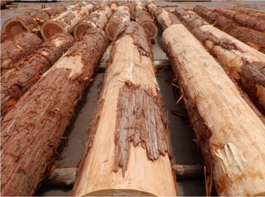
R4. 5. 25春季優良原木市 (220~237)