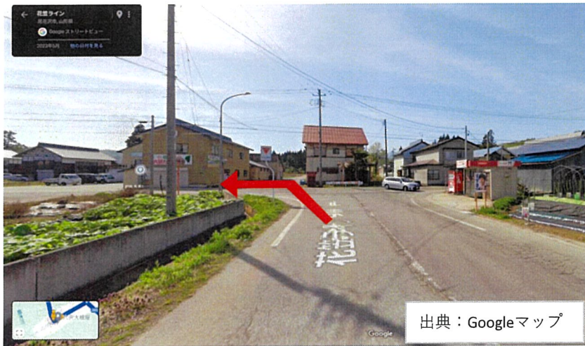
写真① 県道29号で左折